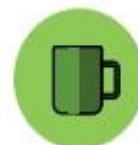
Objetos ou superfícies contaminadas