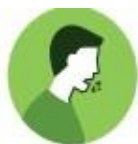
Gotículas de saliva

A transmissão acontece de uma pessoa doente para outra ou por contato próximo (cerca de 2 metros), por meio de: