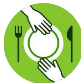
Não compartilhe objetos de uso pessoal