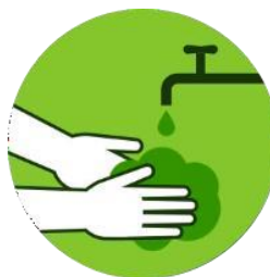
lavar as mãos