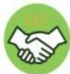
Toque ou aperto de mãos