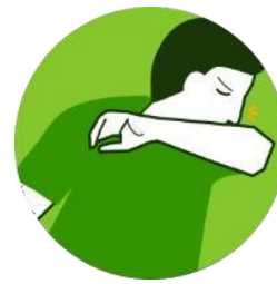
Ao tossir ou espirrar, cubra nariz e boca